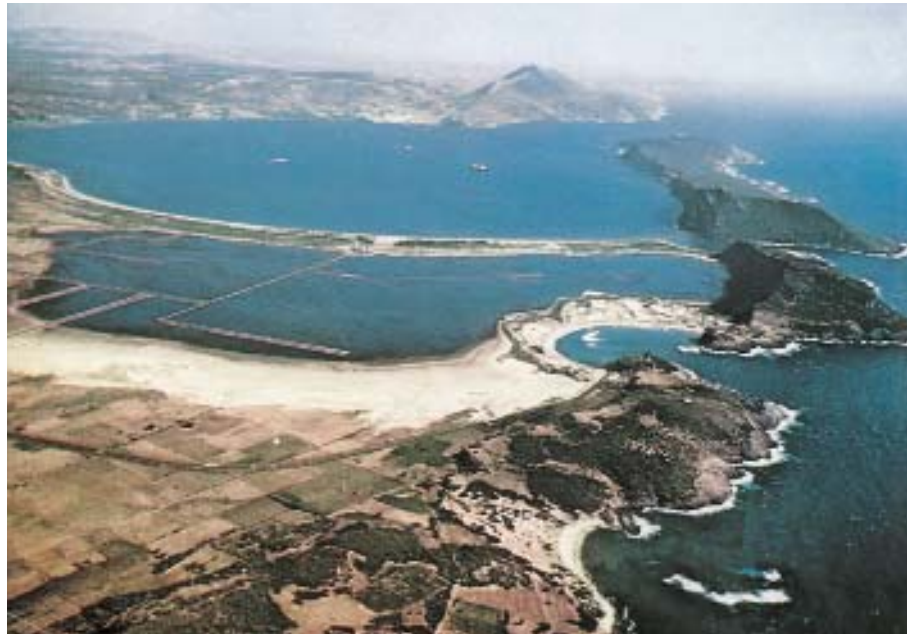
Sfakteria, het eiland waar de Atheners 420 Spartanen opsloten, is rechts op de foto te zien.

gelegenheid de stad te verbeteren. Op de Acropolis werden de beroemde tempels afgebouwd, zoals het Parthenon en het Erechtheion. De graanhandel op de Zwarte Zee en de uitvoer van aardewerk namen steeds toe. Tegelijk groeide het zelfvertrouwen in de stad. Nieuwe staatslieden kregen invloed. Onder hen was Alkibiades. In tegenstelling tot Kleon was hij van adellijke afkomst. Doordat hij goed kon praten, kreeg hij de volksvergadering met gemak op zijn hand.